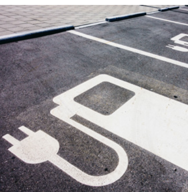
Environnement → page 11