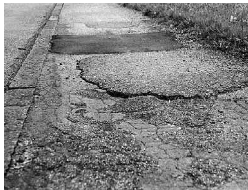
Bild 3: Mangelhaft ausgebessertter Belag. Niveaudifferenzen sind möglichst klein zu halten.