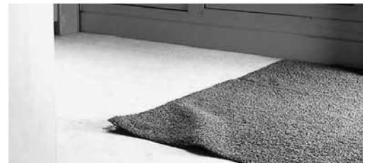
Bild 5: Hochstehende Teppichkanten können z. B. mit Leisten gesichert werden.