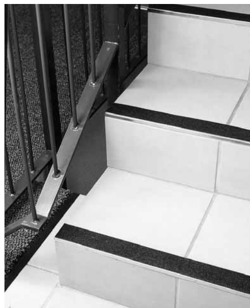
Bild 2: Nachträglich angebrachte Gleitschutzstreifen auf einer glatten Steintreppe.