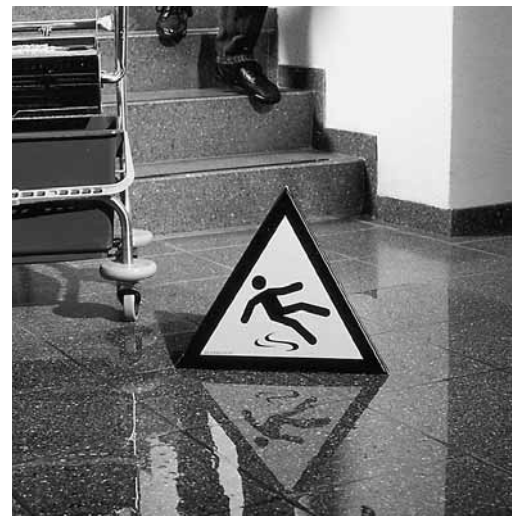
Bild 7: Glitschige Stellen (z. B. nach Reinigungsarbeiten) und temporäre Stolperfallen (Kabel, Schläuche usw.) sind zu signalisieren oder abzuschränken.