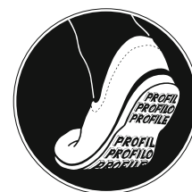
Bild 8: Sicherheitszeichen «Schuhe mit rutschfesten Sohlen tragen» (Suva-Bestell-Nr. 1729/63).