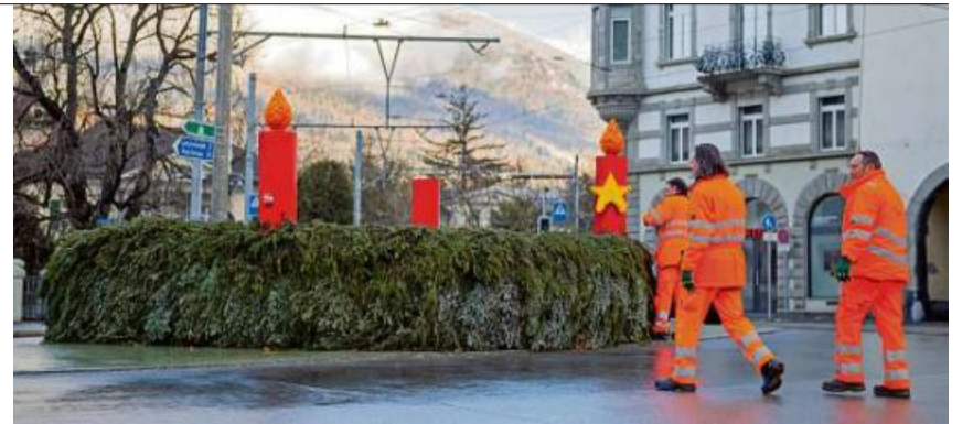
Der Tatort: Mitarbeiter der Stadt Chur räumen den Lego-Adventskranz wieder ab – oder was davon noch übrig ist.