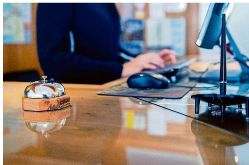
Hand in Hand: Im Rahmen der Plattform Hospitality Collaboration Lab haben Hotellerie etwa die Möglichkeit, dank Kooperationen ihre Kosten zu senken.

Ebenfalls entstand die Idee der Fachkräfteinitiative «All in one», bei der Arbeitskräfte im Bündner Tourismus von zusätzlichen Anreizen rund um die Job- und Wohnungssuche sowie Freizeitgestaltung profitieren sollen: beispielsweise von Bergbahn-Abos. An dem Projekt wird aktuell weitergearbeitet.